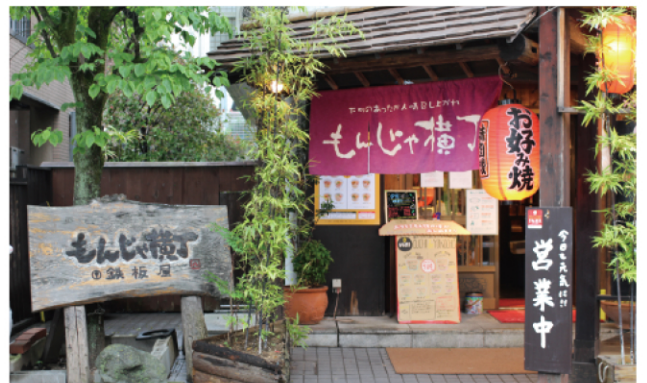
下町情緒あふれる外観が魅力の「もんじゃ横丁 戸塚店」

想しかありませんでした。それなのに、店長をはじめスタッフが前を向いて進もうとしていて。そこで一気に目が覚めて、「今、やれることを頑張ろう」と心に決めました。